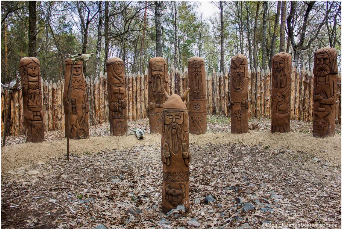
Рисунок 1 – Древнеславянское капище. Современная реставрация.