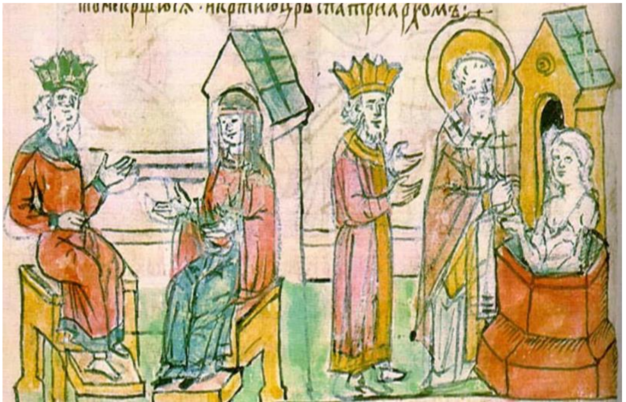
Рисунок 3 – Крещение княгини Ольги. Миниатюра.