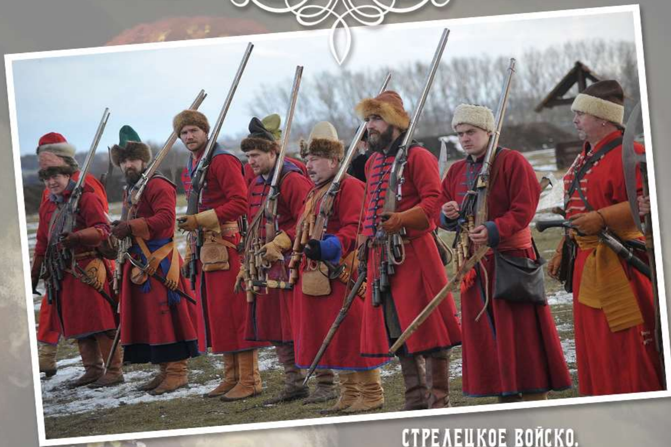
СТРЕЛЕЦКОЕ ВОЙСКО. СОВРЕМЕННАЯ РЕКОНСТРУКЦИЯ.